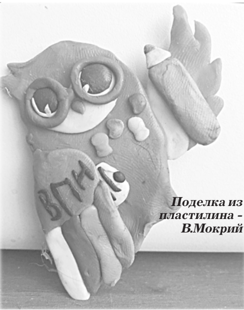
Поделка из пластилина - В.Мокрый